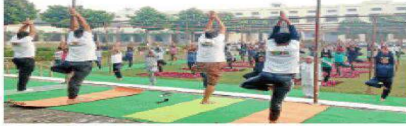
बकेवर जनता कॉलेज में योग कराते संस्थान के पदाधिकारी