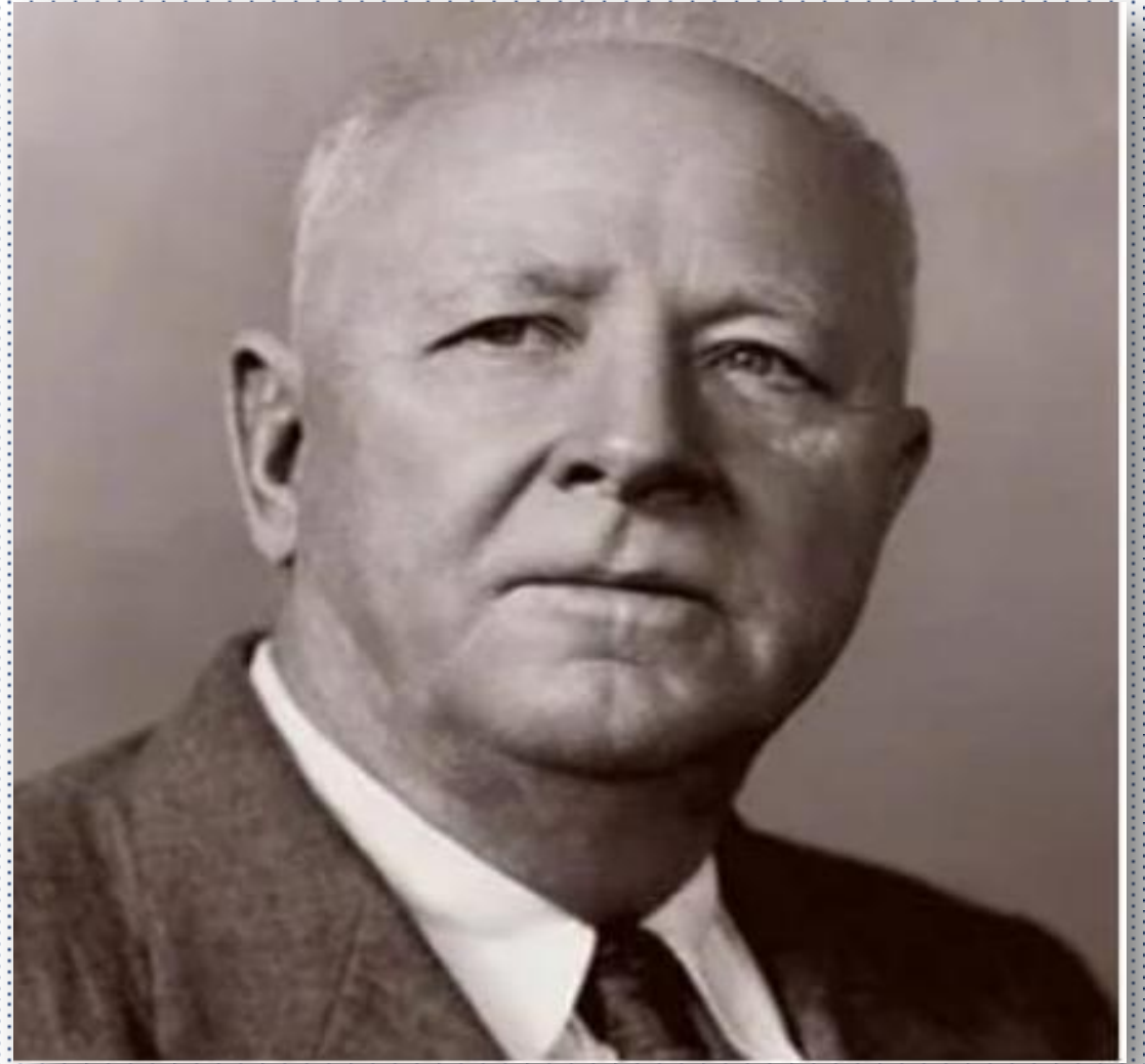
Father of Soil Conservation "Dr. Hugh Hammond Bennett" 15 April 1881 – 07 July 1960