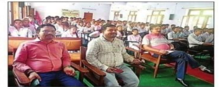
कार्यक्रम में शामिल शिक्षक व छात्र-छात्राएं। संवाद

बकेवर। जनता कॉलेज बकेवर में कृषि के सार्वभौमिक छात्रों का ग्रामीण कृषि कार्य अनुभव (रावे) कार्यक्रम के लिए कुल 14 गांवों का चयन किया गया। इसमें विकासखंड महेवा के बहेड़ा, शेरपुर कोटी, आमहार, जगमोहनपुरा, व्यासपुरा, बिजौली, परसपुरा, नगला बनी, हरसपुर, गौतमपुरा, मनियामऊ, खिरारी और अनूपुर का चयन किया गया है।