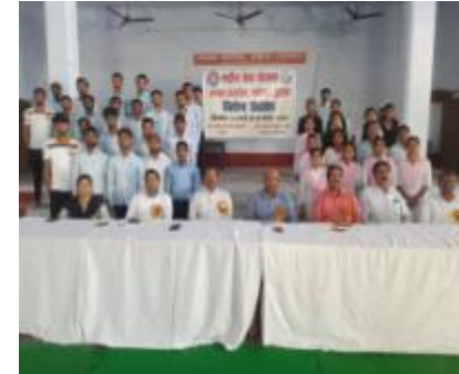
छात्रों का एक समूह की तस्वीर।