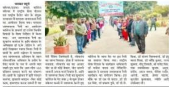
छात्रों ने मतदाता जागरूकता रैली में भाग लिया और मतदान की प्रक्रिया के बारे में लोगों को शिक्षित किया।