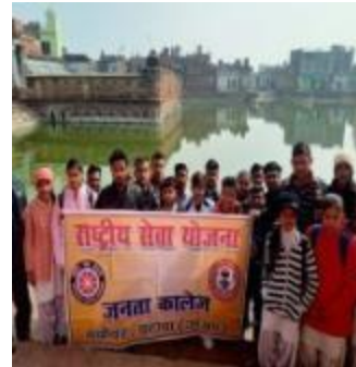
छात्रों ने 'राष्ट्रीय सेवा योजना' के तहत एक कार्यक्रम में भाग लिया।