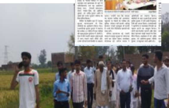
छात्रों ने एक क्षेत्रीय गतिविधि में भाग लिया।