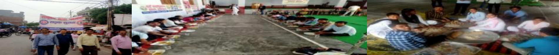
छात्रों का एक बड़ा समूह की तस्वीर।