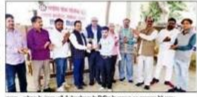
संकेतक के प्रमुख अधिकारियों की विशेष प्रशिक्षण टीम का शुभारंभ।

मुख्य अधिकारी, संकेतक, शिक्षण और प्रशासनिक कर्मियों को प्रशिक्षण देने के लिए विशेष कार्यक्रम आयोजित किया गया। इसमें मुख्य अधिकारी, संकेतक, शिक्षण और प्रशासनिक कर्मियों को प्रशिक्षण देने के लिए विशेष कार्यक्रम आयोजित किया गया।