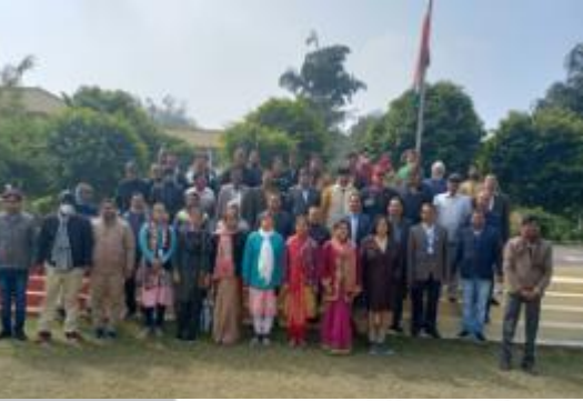
स्टावा संसार | www.rashtriyasahara.com