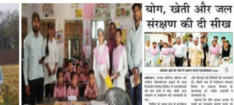
छात्रों ने एक जल संरक्षण कार्यक्रम में भाग लिया।