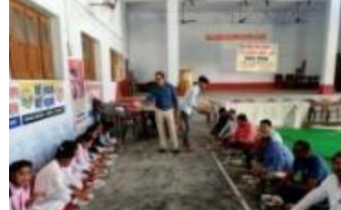
छात्रों ने एक स्वास्थ्य शिविर में भाग लिया और लोगों को शिक्षित किया।