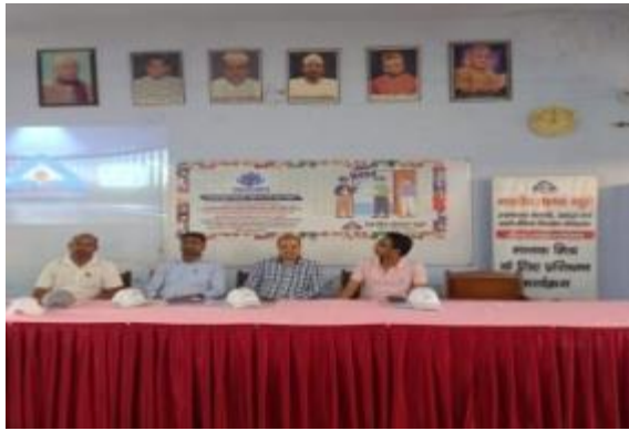
कानपुर, शनिवार 14 अक्टूबर, :