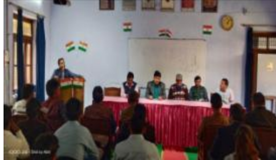
छात्रों ने एक बैठक में भाग लिया और अपने अनुभवों को साझा किया।