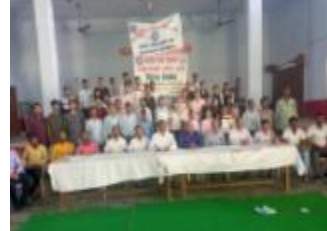
छात्रों ने राष्ट्रीय मेवा दिवस के तहत एक शिबिर का आयोजन किया।

छात्रों ने राष्ट्रीय मेवा योजना के तहत एक शिबिर का आयोजन किया और लोगों को शिक्षित किया।