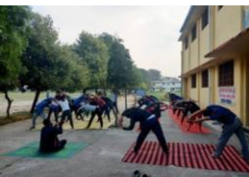
छात्रों ने एक सांस्कृतिक प्रदर्शन में भाग लिया।

छात्रों ने राष्ट्रीय सेवा इकाई के तहत एक सात दिवसीय शिबिर का शुभारम्भ किया।