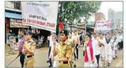
रैली निकालने एनसीसी कैंडेट और छात्रों।

जनता कॉलेज बकेवर के एनसीसी व एनएसएस विभाग ने की संगोष्ठी संगठन न्यू एजेंसी