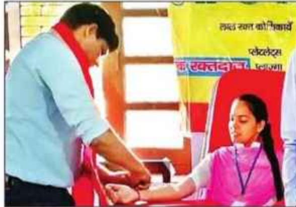
स्वास्थ्य शिविर में रक्तदान करती छात्रा।