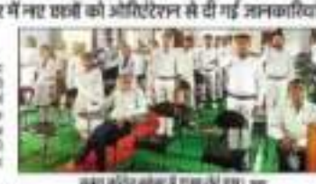
अनलाइन क्विज में नए छात्रों को ऑरिएंटेशन से दी गई जानकारी।

कानपुर। केंद्रीय शिक्षा बोर्ड के तहत छात्र-छात्राओं को मोबाइल के सीमित प्रयोग की सलाह दी गई। ए.एस.पी. ने छात्र-छात्राओं को मोबाइल के सीमित प्रयोग की सलाह दी।