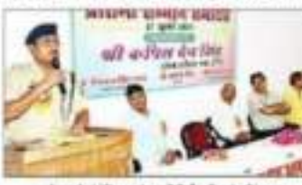
कानपुर के ए.एस.पी. ने 300 छात्र-छात्राओं को प्रमाणपत्र देकर किया प्रोत्साहित किया।

कानपुर। केंद्रीय शिक्षा बोर्ड के तहत 300 छात्र-छात्राओं को प्रमाणपत्र देकर किया प्रोत्साहित किया गया। ए.एस.पी. ने 300 छात्र-छात्राओं को प्रमाणपत्र देकर किया प्रोत्साहित किया।