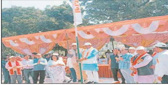
विद्यालय में ध्वजारोहण करते सांसद रामशंकर कठेरिया।